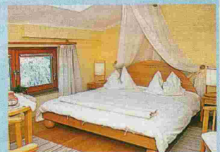
Komfort der biologischen Art: Das Panoramahotel Wagner ist mit Vollholzmöbeln der Marke „Grüne Erde“ ausgestattet.

trug irgendwann nicht mehr. Als die Ansprüche der Gäste und die Kaviarteller immer größer wurden, beschloss Wagner den Umstieg: Er gilt heute als Pionier der biologischen Gourmetküche. Womit eindrucksvoll bewiesen wäre, dass Naturkost eben die allerhöchste Form des Genusses ist. ■